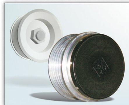
Bild 2: Das Innere der OAPs und OADs wird durch eine Kappe geschützt.

Angaben des Fahrzeugherstellers beachten!