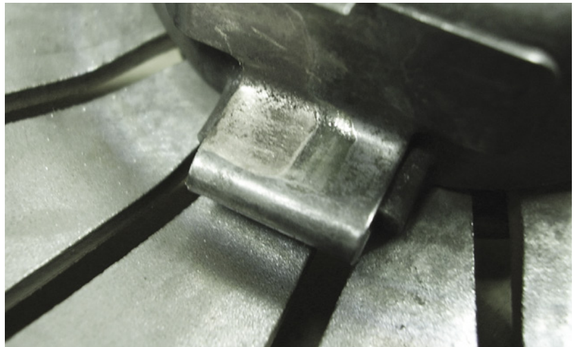
Bild 4: Ausrücklager mit Verformung im Bereich der Aufnahme der Ausrückgabel

Zusätzlich sollte beim Austausch der Kupplung die Tellerfeder der bisher verwendeten Druckplatte auf Beschädigungen geprüft werden.