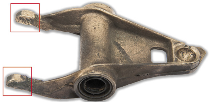
Bild 2: Eine verschlissene Ausrückgabel sollte ausgetauscht werden